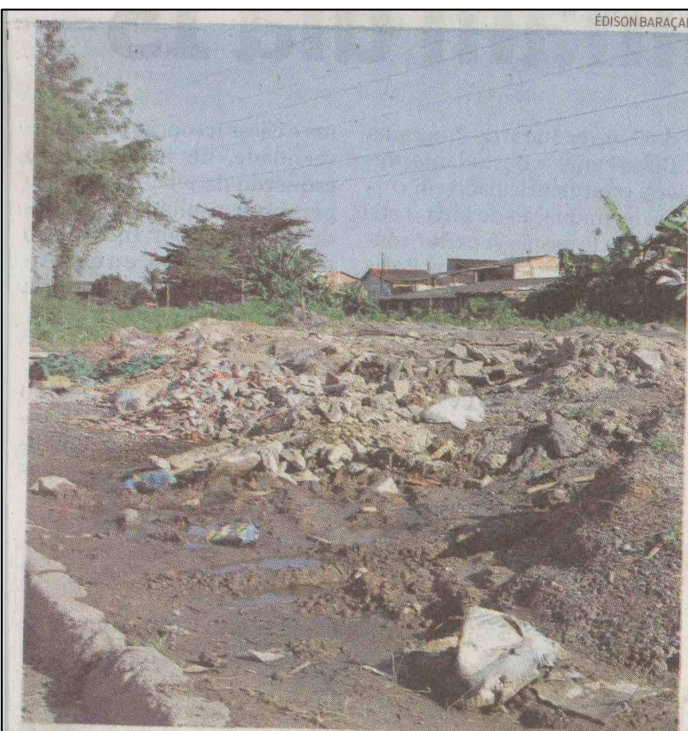
Na Rua Matão, na Vila Áurea, obras estão paralisadas desde maio

seriam implantadas as tubulações) e não voltaram mais”, disse ela, que reclamou das condições que os funcionários da Saenge deixaram a via.